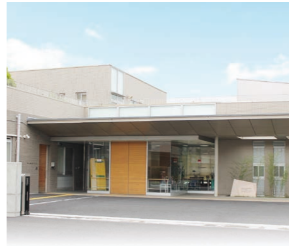
建築面積 1,811.83 平方メートル 延床面積 2,725.78 平方メートル 構造規模 鉄筋コンクリート造 2 階建

平成23年度より障害者自立支援法の就労継続支援B型、生活介護へと事業移行し、平成24年度より特定相談支援事業を開始、令和3年度より現在の事業形態に至っています。