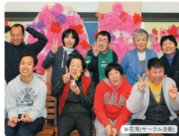
お花見(サークル活動)

日々の作業以外にも「日帰り旅行」、「忘年会(新年会)」、ご利用者と支援員が協力しながら企画実行するサークル活動での「お花見」など、皆で楽しむイベントもあり、メリハリのある生活となっています。