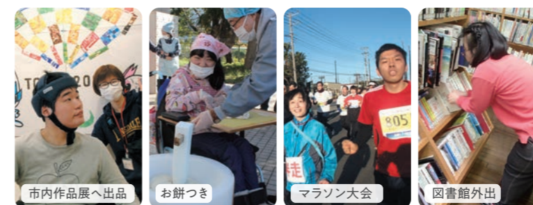
市内作品展へ出品